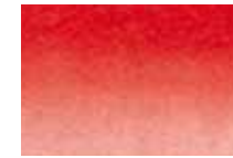
674 Vermillon Vermilion