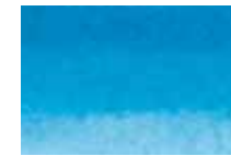
303 Bleu de Cobalt Cobalt Blue