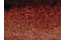
449 Bistre Bistre