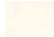
01 Blanc Opaque Opaque White