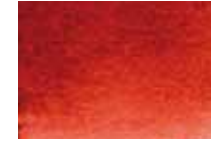
270 Sanguine Sanguine