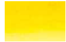
519 Jaune Sénégal Senegal Yellow