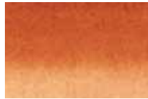
211 Terre de Sienne Brûlée Burnt Sienna