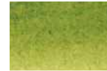
813 Vert Olive Olive Green