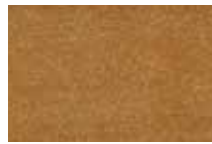
03 Or Gold