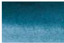
308 Indigo Indigo Blue