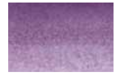
931 Teinte Neutre Neutral Hue