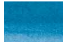
318 Bleu de Prusse Prussian Blue