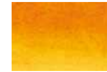
641 Orange Orange