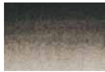
Encre de Chine Indian Ink "à la Pagode"

Sennelier inks, which are likened to China inks, are available in a selection of high quality colours. Extremely rich, these inks are manufactured with shellac gum giving to each shade unique brilliance, brightness and vibration under light. They can be applied with a brush or ink pen and give a satin to brilliant film depending on thickness. They dry rapidly and display a high degree of water resistance, without being indelible. These inks are highly sought after for calligraphy, quill drawings and washes as well as for textile creations and materials research. They can be protected with a pencil fixative in order to increase their light stability. China Ink "à la Pagode" available in bottles, is deep black and indelible. Of exceptional density and light stability, it is used by drawing artists and painters.