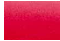
681 Ecarlate Scarlet