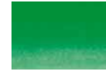
873 Vert Printemps Spring Green