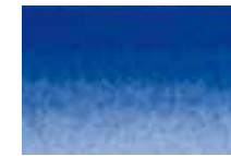
315 Bleu Outremer Ultramarine Blue