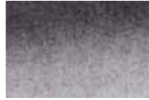
701 Gris Grey