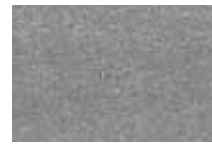
02 Argent Silver