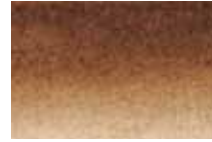
453 Brou de Noix Walnut Stain