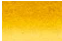
223 Terre de Sienne Sienna