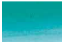
341 Bleu Turquoise Turquoise Blue