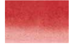
405 Brun Rouge Red Brown