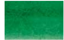
803 Vert Foncé Deep Green