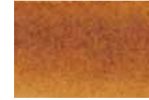
438 Sépia Sepia