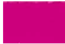
667 Pourpre Purple