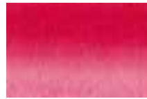
635 Carmin Carmine