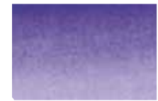
901 Violet Violet